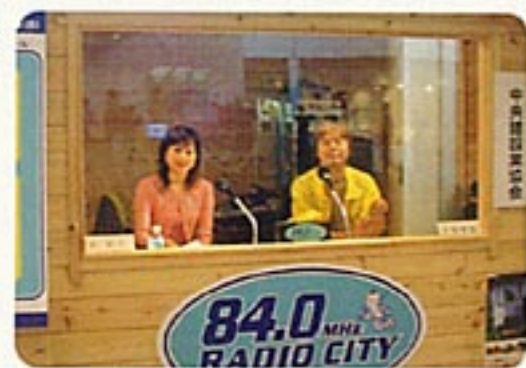
中央FMの実況放送中 ▶

▲午前中、区内の城東、明石、佃島、有馬、月島第三、明正、月島第二など各小学校の皆さんがおおぜい見学に見えました。